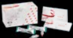
EQUIA Forte™ HT