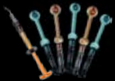
G-aenial™ Family G-aenial Universal Injectable

... die erfolgreichen Restaurations- und Befestigungssysteme von GC!