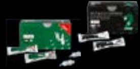
GC Fuji™ IX GP FAST GC Fuji II LC