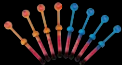
GRADIA® DIRECT Family